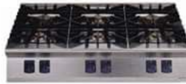
Set Üstü Ocak