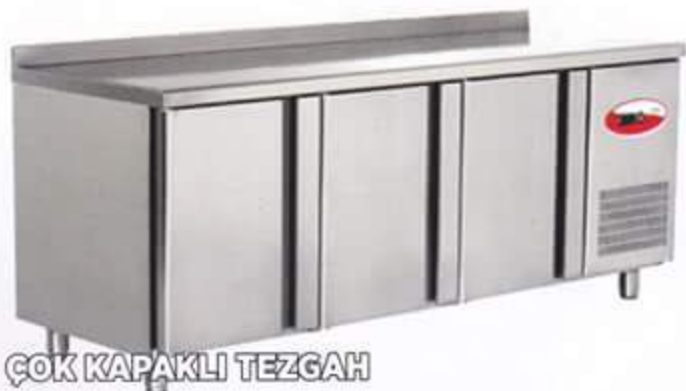
ÇOK KAPAKLI TEZGAH