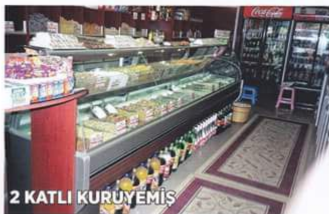
2 KATLI KURUYEMİŞ