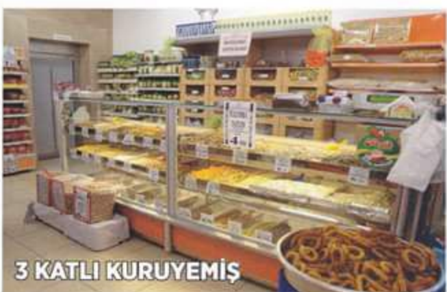
3 KATLI KURUYEMİŞ