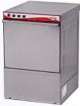
Set Altı B. Makinesi