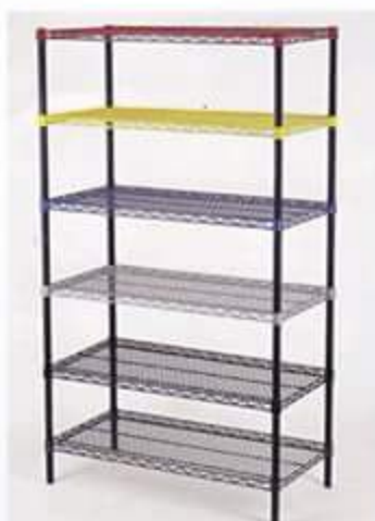
Krom ve Boyalı Raf