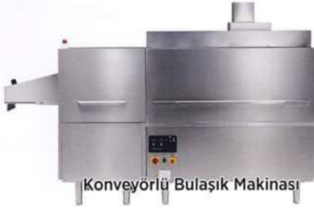
Konveyörlü Bulaşık Makinası