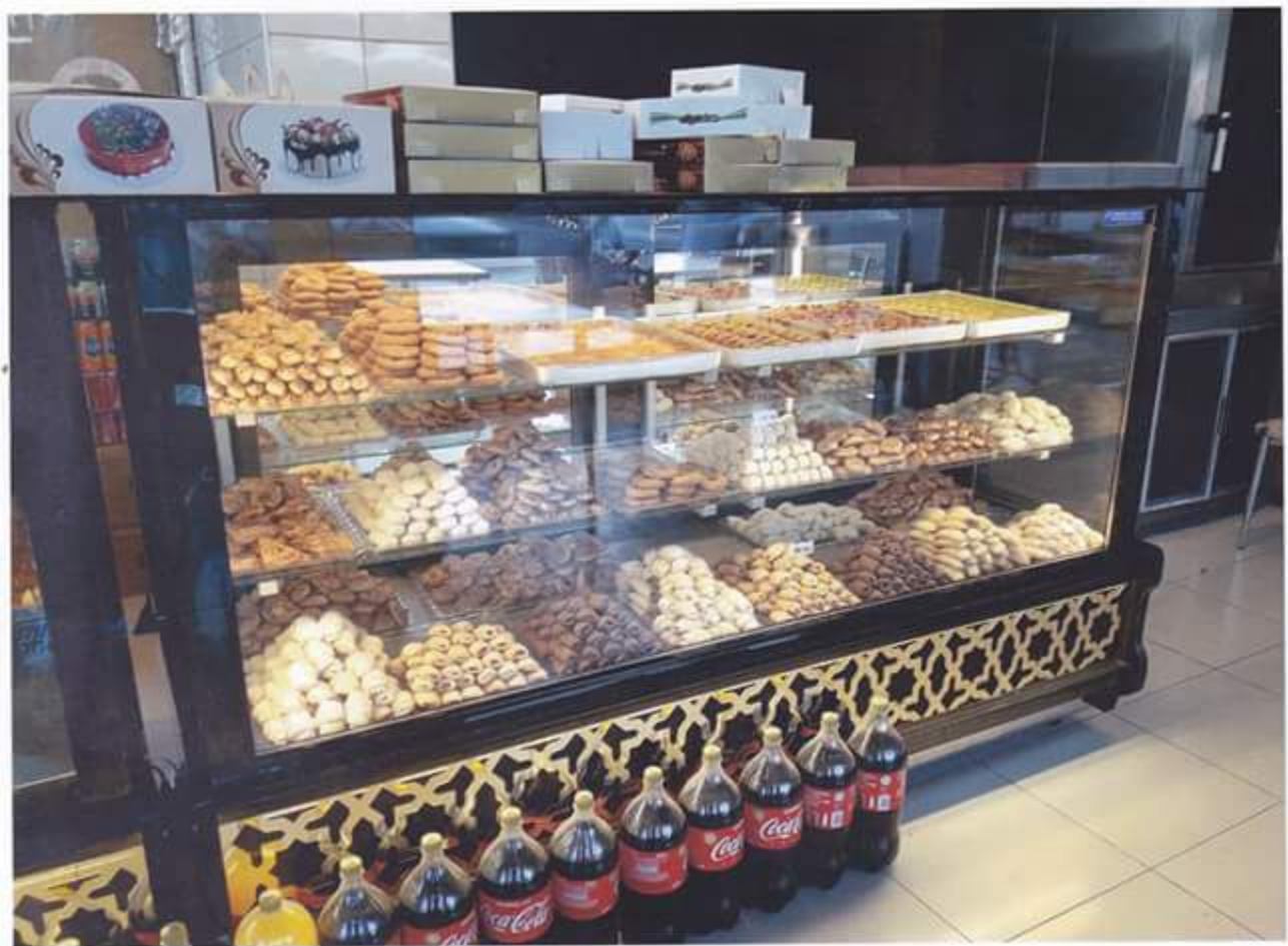
Kombine Pasta Dolapları