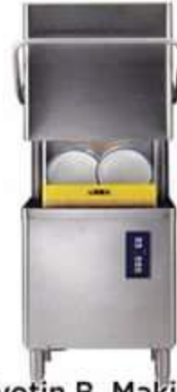
Giyotin B. Makinesi